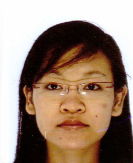
SOK Sonaly L2-P7