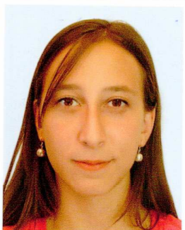
FERI Adeline Prépa BCPST-Marseille