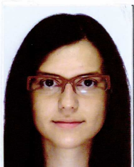
CICO Alba L2-P7