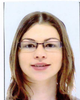
DURCHON Marine L2 bio-Caen