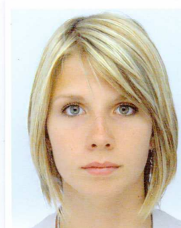
SYX Laurène L2-P7