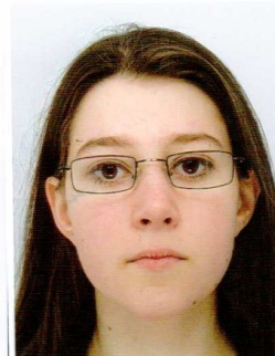
POUCH Juliette L2 BioMéd P5